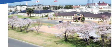
桜満開の「Risner Circle」と基地司令官の建物