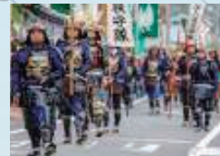
海兵隊員が鞍掛城まつりに参加