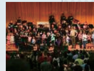
ホリデーコンサート