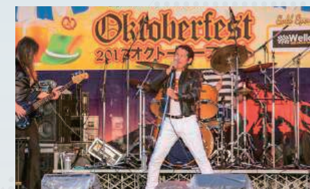
オクトーバーフェストでは、本場ドイツのビールと料理、ダンスなどが楽しめます。