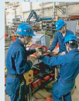
Making of flexible hose フレキシブルホースの作製