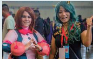
コミックコンテスト

那覇方面から車でアクセスする場合、国道58号線を北上、「北谷町北前」信号の手前、右側にキャンプ・フォスター北前ゲート(第5ゲート)があります。