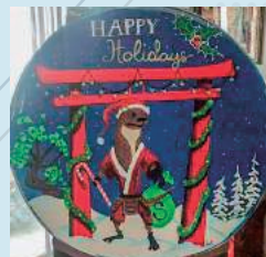
クリスマスシーズン 第35経理部のエンブレム装飾