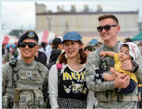
地域社会との親睦を図るため、「日米友好祭」などの開放行事を行っています。

最寄り駅はJR青梅線の福生駅、牛浜駅または拝島駅(JR八高線/西部拝島線乗り入れ)。福生駅から第2ゲートまでは徒歩約15分、牛浜駅から第5ゲートまでは徒歩約10分、拝島駅から第5ゲートまでは徒歩約20分。