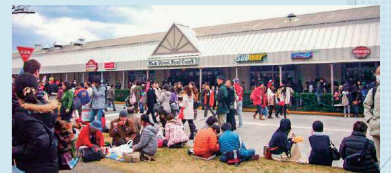
フードコートのメインストリート