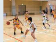
日米親善青少年バスケットボール大会