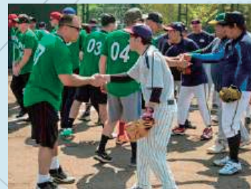
日米ソフトボール大会