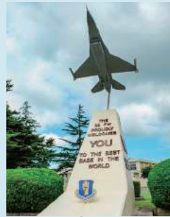
三沢基地メインゲート