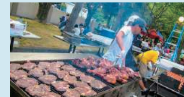
フレンドシップデー