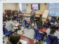
大学の学生たちとの交流