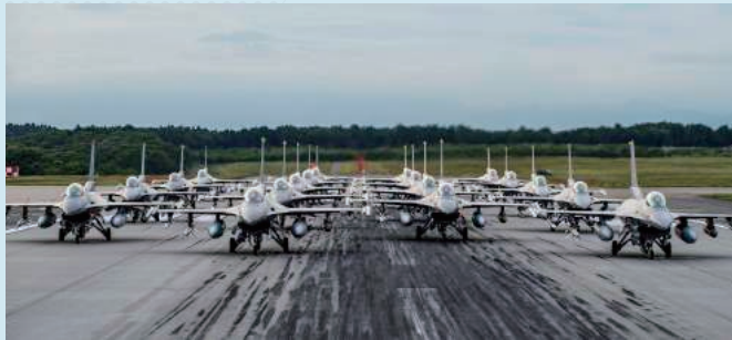
米空軍の用語で「Elephant Walk」と呼ばれる、航空機が整列しているところの写真

青森県三沢市に位置する三沢飛行場は、日本で唯一、米軍、航空自衛隊、民間航空会社が共同で使用している飛行場です。管理部隊は、米空軍の第35戦闘航空団です。三沢では、毎年6月に三沢アメリカンデーが開催され、その日は三沢飛行場のメインゲートが開放され、イベントを楽しむことができます。