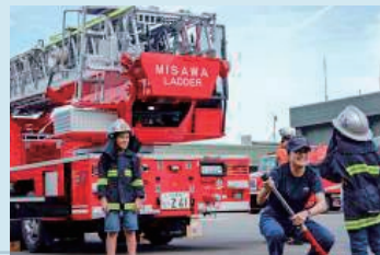
「防災週間」のイベント