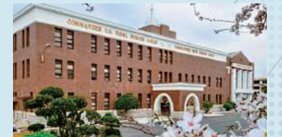
横須賀基地司令部の建物