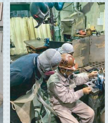
Training of the arc weld アーク溶接トレーニング

●エルモホームページアドレス(パソコン及びスマートフォン) https://www.lmo.go.jp LMO