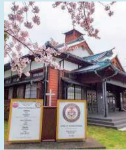
旧帝国海軍の武道場だった建物は、内部を改装し現在教会として使用されています。