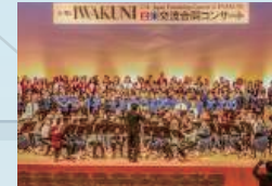
日米交流合同コンサート