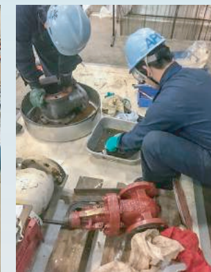
Cleaning each parts 各種部品の洗浄