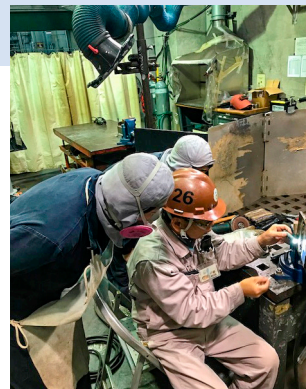
Training of the arc weld アーク溶接トレーニング