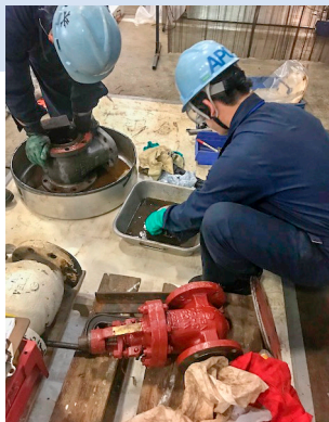
Cleaning each parts 各種部品の洗浄