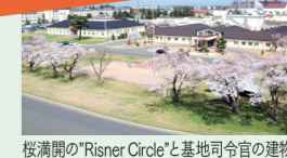
桜満開の「Risner Circle」と基地司令官の建物