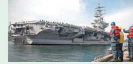
米海軍横須賀基地に入港する5千人を超える乗組員を擁する空母ロナルド・レーガン。

その他、エルモホームページにも紹介記事を掲載しています。 https://www.lmo.go.jp/recruitment/index3.html