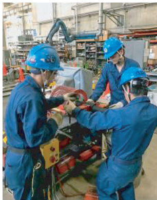
Making of flexible hose フレキシブルホースの作製