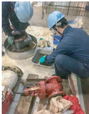
Cleaning each parts 各種部品の洗浄