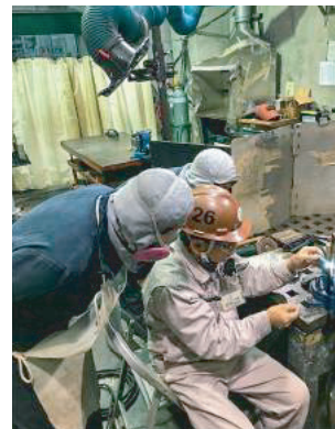
Training of the arc weld アーク溶接トレーニング