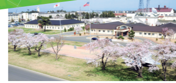
桜満開の「Risner Circle」と基地司令官の建物