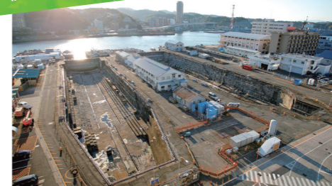
明治から昭和にかけて建造されたドライドックなど、貴重な近代化遺産が残されています。