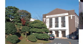
米海軍横須賀基地司令部。横須賀鎮守府時代の建物を使用しています。