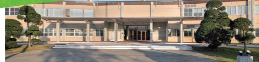
在日米陸軍司令部の建物-通称リトルペンタゴン