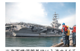
米海軍横須賀基地に入港する5千人を超える乗組員を擁する空母ロナルド・レーガン。

●その他、エルモホームページにも紹介記事を掲載しています。 https://www.lmo.go.jp/recruitment/index3.html