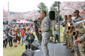
毎年春に開催される桜まつりでは、軍楽隊が演奏をしてお祭りを盛り上げます。